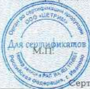
Схема сертификации: Ic